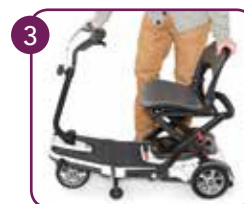
Vouw de stoel uit en vergrendel op plek