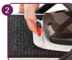
Trek aan hendel en vouw op