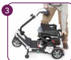
Vouw op en vergrendel met handvat