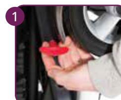
Trek aan hendel