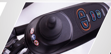
Swing away controller