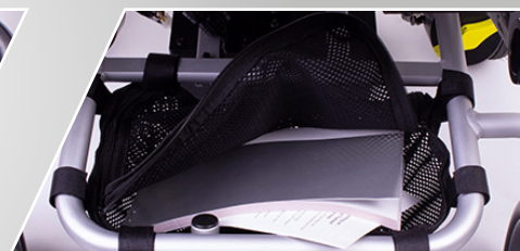
Opbergruimte onder het zadel