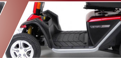
Voor- en achtervering